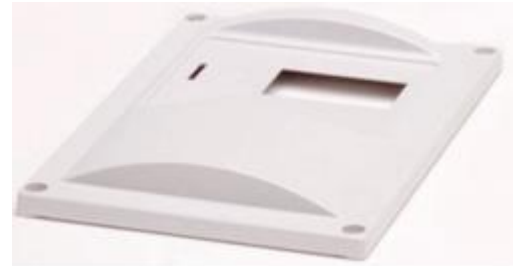
这种 Cerlic 控制箱的外壳箱盖可以定制。