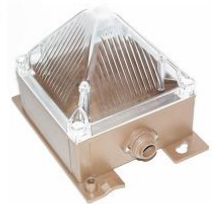
...就像这个 Pfannenber GmbH 金字塔型灯光箱一样，定制的外壳可以为设备生产厂商降低成本。