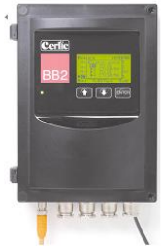
如上图所示的 Cerlic 控制箱单元，可以为客户定制...